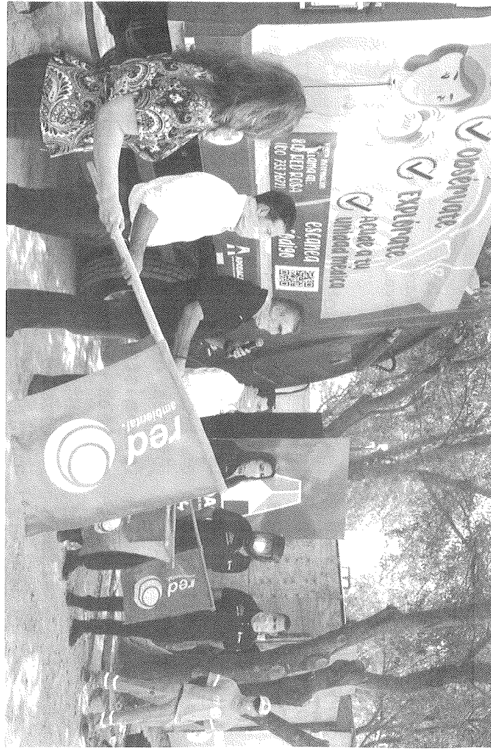
Las nuevas unidades de recolección de basura que contienen la campaña preventiva contra el cáncer de mama.

cretario de Servicios Públicos, quienes acompañaron al Alcalde, dando el banderazo de salida al camión.